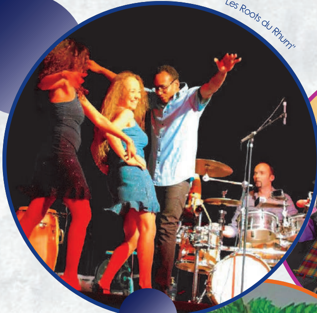
soirée de clôture - "Les Roots du Rhum"