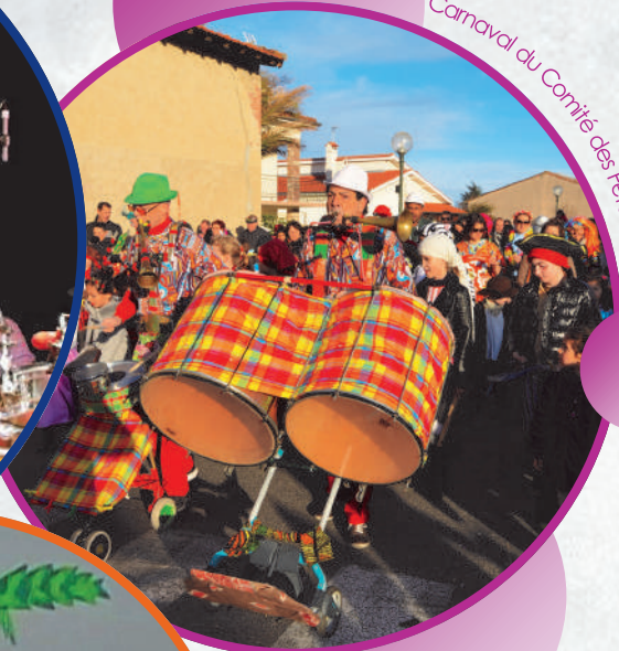
Carnaval du Comité des Fêtes